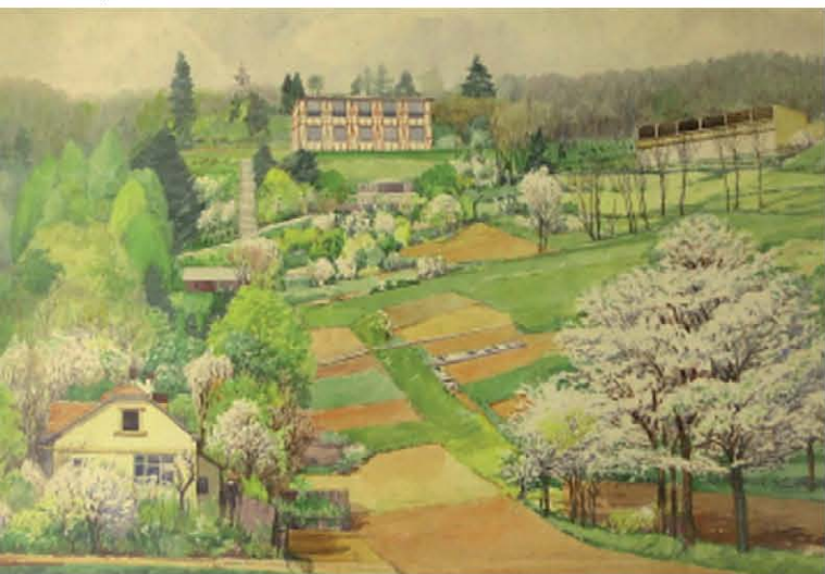
Olejomalba znázorňující zahradně upravenou centrální část lesoparku. V pozadí ženský pavilon, napravo lehárna (dvacátá léta 20. stol.).

Městská část Brno-Nový Lískovec se zapojila do projektu mezinárodní spolupráce s názvem UrbSpace (zkratka pro „Urban Spaces“), český plným názvem „Městské prostory – zvyšování atraktivity a kvality městského prostředí“.