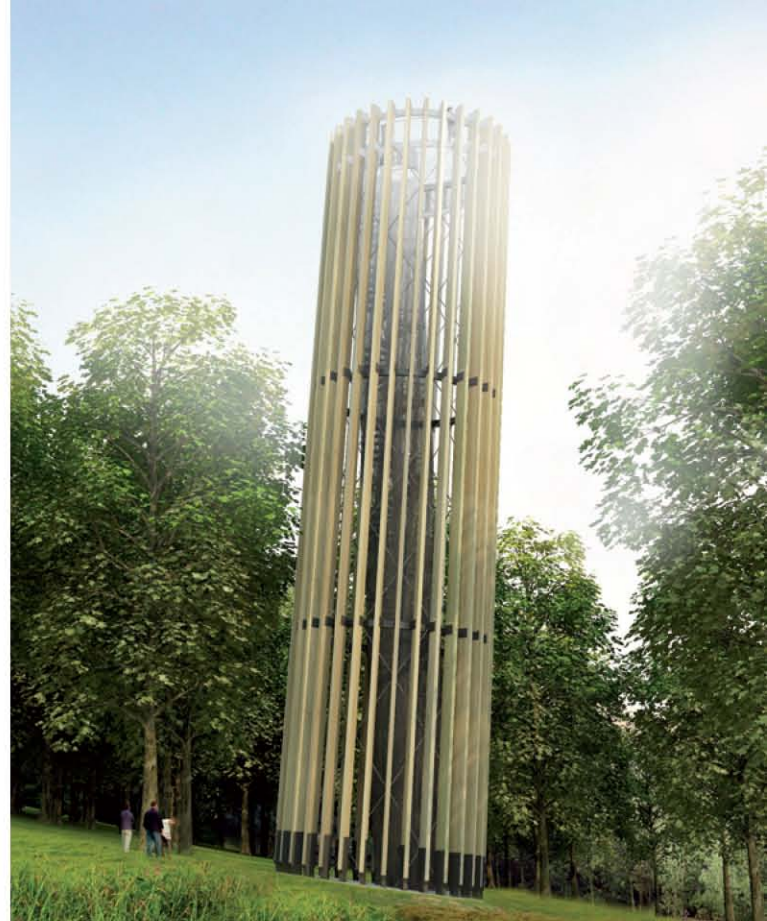
Vizualizace nové rozhledny (Atelier Štěpán).

Původní rozhledna je dnes v havarijním stavu, navrhujeme její rekonverzi na místo k zastavení a občerstvení pitnou vodou. V centru svažitého lesoparku je znatelná největší původní úprava terénu – zářez pro ženský